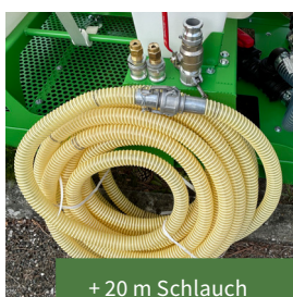
+ 20 m Schlauch