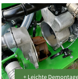
+ Leichte Demontage

Der Hydroseeder eignet sich somit für den Einsatz in Betrieben des Garten- und Landschaftsbaus, Baumschulen und in kommunalen Betrieben, die in der Grünflächenpflege tätig sind.