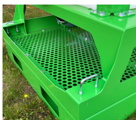
+ 2x Zurrhaken hinten